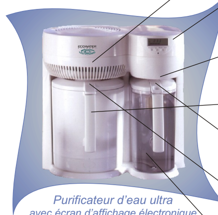
Purificateur d'eau ultra avec écran d'affichage électronique

L'eau purifiée est recueillie dans le pot à eau de service, prête à être utilisée.